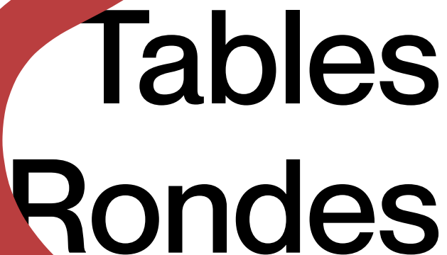
Table ronde 1

Thème : Abonnements de périodiques : quelle gestion ?